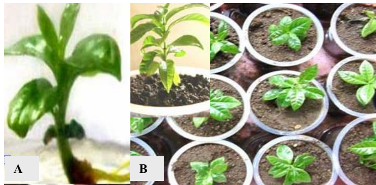
Gambar 2. (A) Planlet kopi arabika, dan (B) tahapan aklimatisasi, insert-tanaman kopi di rumah kaca.